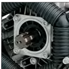
ANT. - AVANT - ANTERIOR