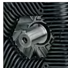
POST. - ARRIÈRE POSTERIOR