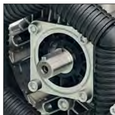
ANT. - AVANT - ANTERIOR