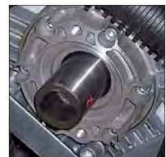
POST. - ARRIÈRE POSTERIOR